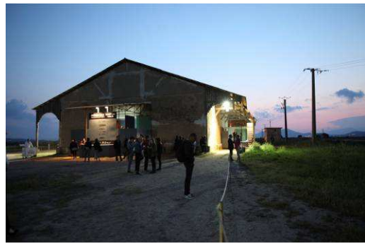
Avril 2011 : le 26 ème Festival international de mode et de photographie défile aux Salins des Pesquiers

La villa Noailles à Hyères lance le premier Design Parade en juillet 2006 : un concours et un festival international, dans les pas du célèbre festival de la mode. Ce lieu emblématique voit défiler chaque année les plus grands créateurs de demain. En 2010, la villa Noailles inaugure son exposition permanente « Une vie de mécènes ». Pièces de mobilier, dessins, photos,... retracent l'histoire de ce haut lieu de l'avant-garde et l'extraordinaire mécénat que Charles et Marie-Laure de Noailles ont mené durant plus de 50 ans. De nombreux travaux de rénovation ont été entrepris par TPM : mise aux normes, exposition permanente, aménagement des cinq chambres d'artistes, réhabilitation des façades et accès mise aux normes PMR (parvis et montée accessibles aux Personnes à Mobilité Réduite).